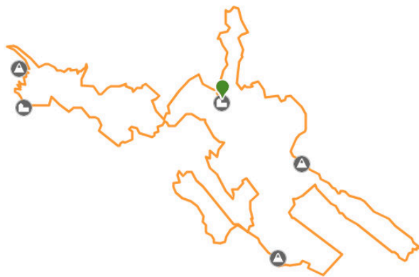
Balizko ibilbidea 2024 Posible recorrido 2024

El gran apoyo recibido por parte de instituciones, patrocinadores, colaboradores y de los más de 200 voluntarios hicieron posible una primera edición exitosa con 500 participantes. Preveemos y deseamos aumentar ese número en esta próxima edición.